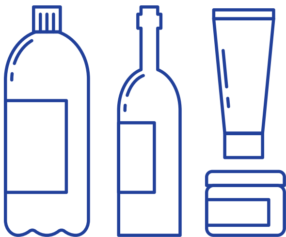
ΠΑΝΩ ΑΠΟ 100 ML